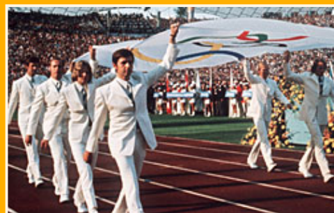
Die Medaillenjagd ist eröffnet: Einzug in das Olympia-Stadion von München

geteilt worden. Die Bilanz der geteilten Spitzenleistungen von München: 20 Medaillen für die Sportler aus der DDR und 13 für die bundesdeutschen.