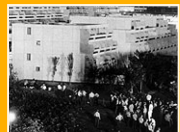
Machtlose Ordnungshüter: Polizisten im Olympiadorf

Die Polizisten im Olympiapark tragen statt Uniformen hellblaue Anzüge und sind nicht mit Waffen, sondern mit Mikrofonen ausgestattet. Die offizielle "Schulungs- und Informationsmappe für Führungskräfte des Ordnungsdienstes" lehrt sie beispielsweise, wie mit Situationen wie der Belagerung des Olympiabergs durch Jugendliche umzugehen ist. Der Vorschlag eines Polizeipsychologen, sich auch auf einen Anschlag auf Mannschaften von Staaten aus Konfliktregionen vorzubereiten, wird laut zeitgenössischen Berichten des "Spiegel" dagegen abgelehnt - "zu unrealistisch", so die Begründung.