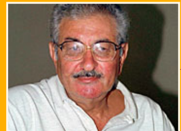
Der Vergeltungsaktion Israels entkommen: Ex-Terrorist Abu Daud

Nicht zu sehen bekommen die Kino-Besucher beim Spielberg-Film, wie den Todesschwadronen des Mossad 1973 ein verhängnisvoller Fehler unterläuft: Die Israelis glauben, den Kopf der Terroristen, Ali Hassan Salameh, im norwegischen Lillehammer ausgemacht zu haben. Statt seiner erschießen die Agenten jedoch einen unschuldigen marrokanischen Kellner auf offener Straße. Einige der Killer werden von der Polizei festgenommen. Die Geheimorganisation wird enttarnt, sie schafft es nicht mehr, Abu Daud, einen Palästinenser, der sich öffentlich zu seiner Beteiligung am Olympia-Anschlag bekennt, zu töten. Auch die drei überlebenden Attentäter von München können sich vor ihren israelischen Häschern verstecken - einer von ihnen stirbt in den Folgejahren eines natürlichen Todes, das Schicksal der anderen bleibt unbekannt.